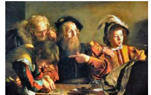
« Vocation de Saint-Matthieu » du Caravage