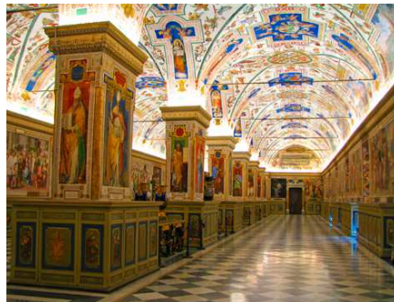
Musée du Vatican

Temps de prière pour la Paix avec la Communauté San Egidio.