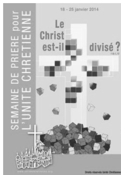
Visuel créé par l'association Unité Chrétienne