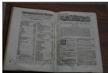
Bible de Genève 1665

Sans être très rare, puisqu'elle existe dans 14 bibliothèques au monde, dont 7 bibliothèques françaises, elle ne figure que dans une seule bibliothèque parisienne, à la Compagnie des prêtres de Saint-Sulpice.