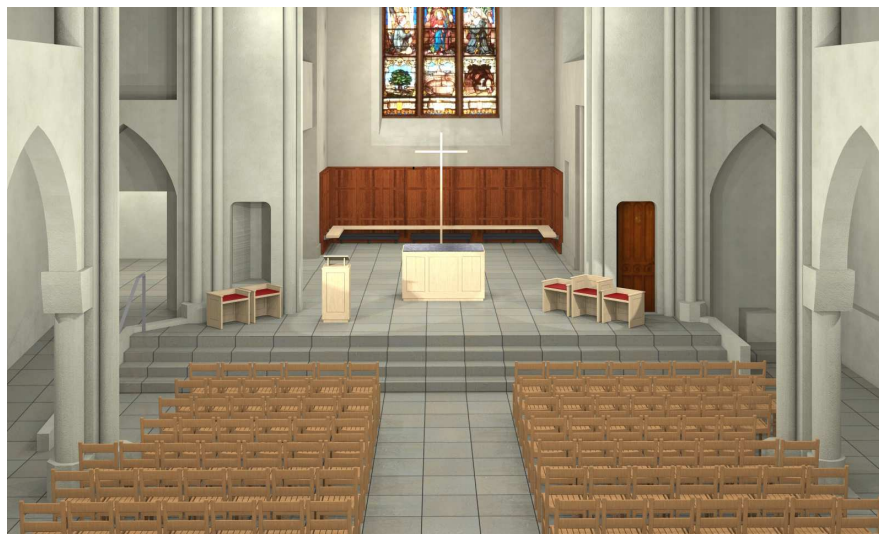
Cette esquisse donne un aperçu de la configuration prévue du chœur. Les couleurs et le mobilier liturgique sont en phase d'affinement.

La taille du chœur va donc être réduite ce qui va permettre d'ajouter deux rangées de chaises dans la nef. Les sièges des célébrants vont être