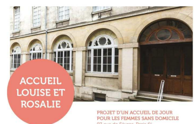
PROJET D'UN ACCUEIL DE JOUR POUR LES FEMMES SANS DOMICILE 97, rue de Sèvres, Paris 6 e

dans lequel de gros travaux ont été menés, et des partenaires privés ainsi que des organismes publics locaux participent au financement. Des partenariats non financiers avec des entreprises et des acteurs locaux sont aussi mis en place et le recrutement et la formation des bénévoles qui assureront cet accueil est en cours. Il reste à financer le mobilier, le budget de communication (postes informatiques, site internet...) ainsi que des dépenses d'hygiène. Vos dons de carême affectés à ce projet contribueront au financement de ces postes de dépenses.