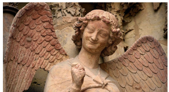
Ange au Sourire de la Cathédrale Notre-Dame de Reims

Dieu guérit c'est le nom de Raphaël qui apparaît dans le livre de Tobie. Il guérit la communion perturbée entre l'homme et la femme. Il guérit leur amour. Il chasse les démons qui,